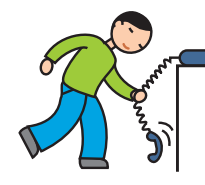
Utilise les objets de façon atypique