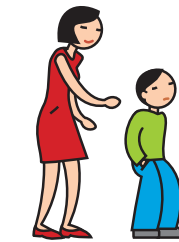
Manifeste de l'indifférence