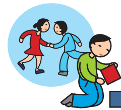
Ne joue pas avec les autres enfants