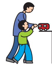
Indique ses besoins en utilisant la main d'un adulte