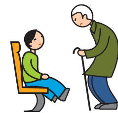
Comprend mal les conventions et les règles sociales