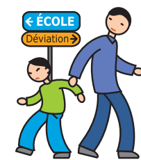
N'apprécie pas les changements