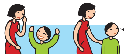
Rit de façon inappropriée