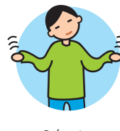
Présente des comportements bizarres