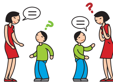
A du mal à comprendre et à se faire comprendre