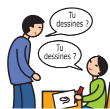
Utilise le langage de façon écholalique