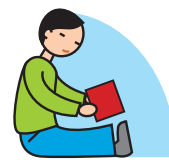
Manque de jeux imaginatifs